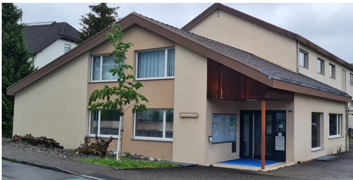
Gemeindeverwaltung, Schulweg 3