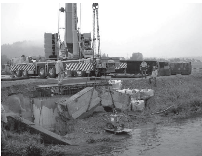
3. Das alte Wiederlager zerbricht beim Heben in zwei Teile.