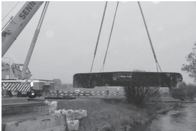
2. Die Brücke schwebt mit einem Gewicht von 88 Tonnen in der Luft.