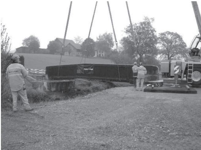
1. Die Hebearbeiten beginnen.