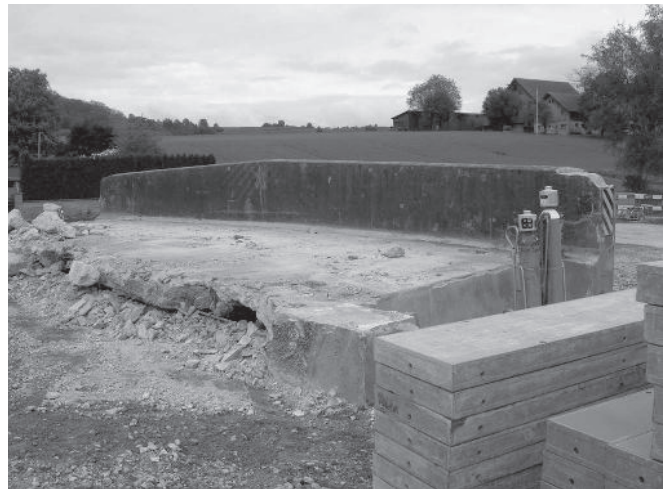
4. Die Brücke wird vor Ort zerlegt.