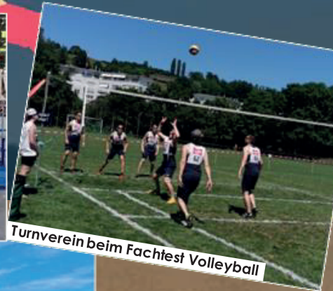
Turnverein beim Fachfest Volleyball