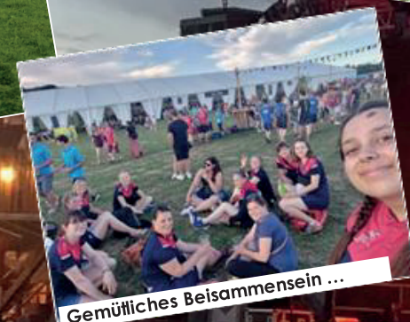
Gemütliches Beisammensein ...