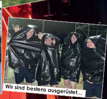
Wir sind bestens ausgerüstet...

Informationen zur Turnfamilie Hendschiken unter: www.stvhendschiken.ch