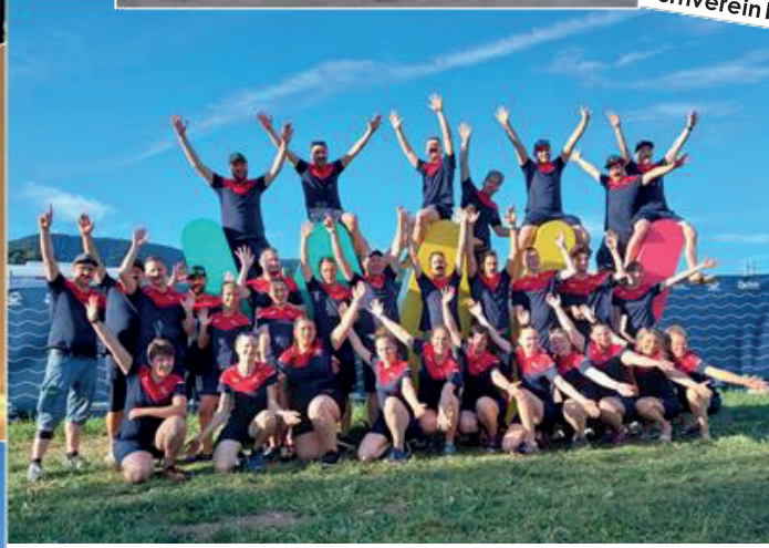
Damenriege und Turnverein mit nigelangelneuer Vereinskleidung